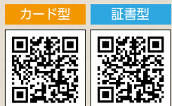
▲教育ローン仮審査はこちらから