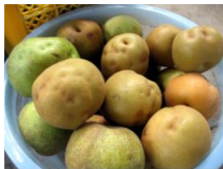
写真2 被害を受けたなし