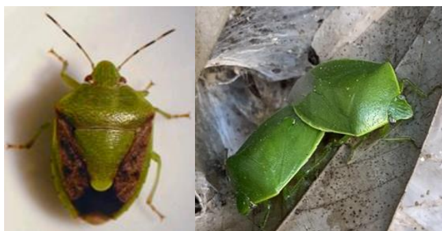
写真1 左：チャバアオカメムシ成虫、右：ツヤアオカメムシ成虫