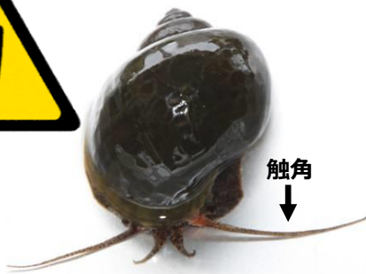
ジャンボタニシ (スクミリングガイ)