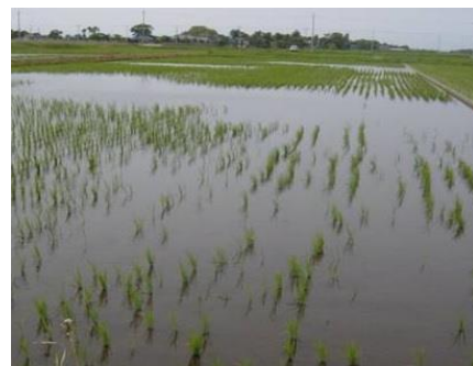
食害を受けた水田