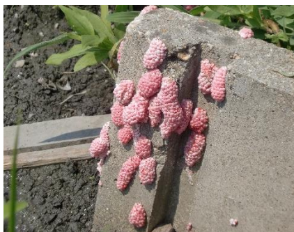
用水路（水口）の卵塊